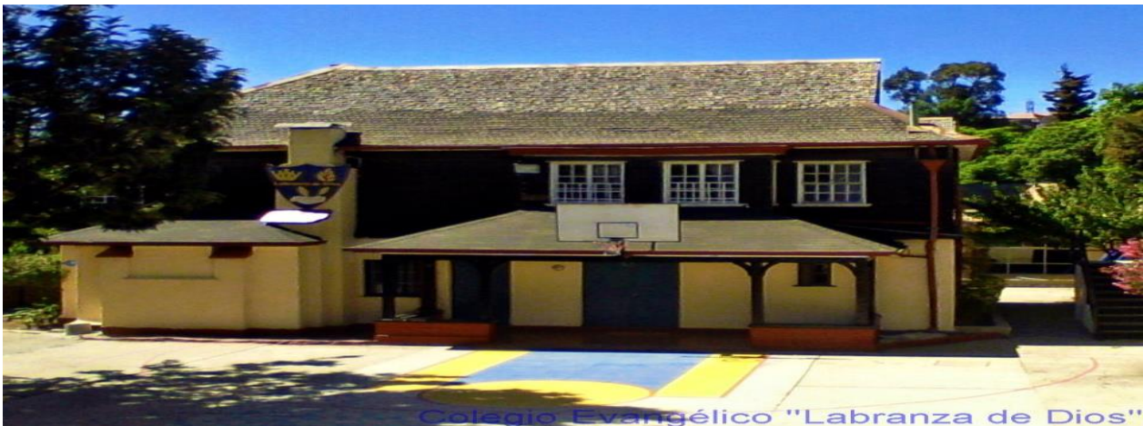
Colegio Evangélico "Labranza de Dios"